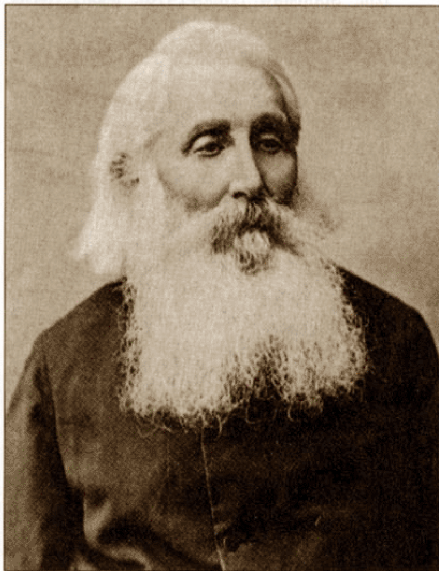
Chaim Zelig Słonimski